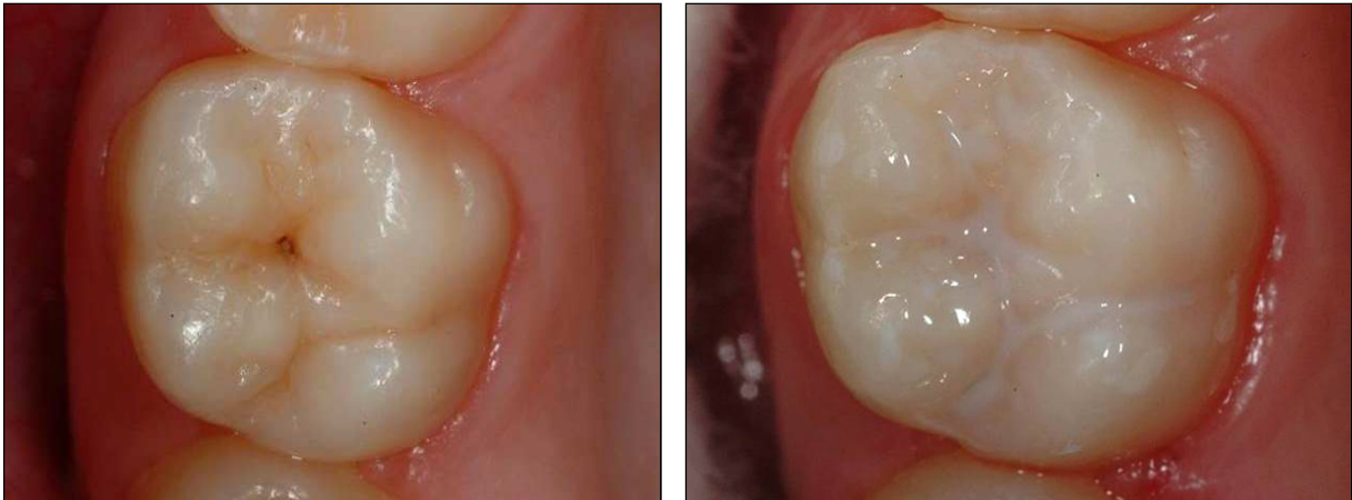
Erster bleibender Molar mit einer nicht kavitierten kariösen Läsion vor und nach der Applikation einer Fissuren- und Grübchenversiegelung.

Schlüsselempfehlung: Der kariespräventive Nutzen der Fissuren- und Grübchenversiegelung an Zähnen bzw. Molaren mit gesunden Fissuren und nicht kavitierten kariösen Läsionen ist belegt. Evidenzstärke: I / Empfehlungsstärke: Stark ↑↑ / Konsensstärke: Stark.